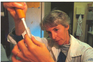
IMMUNSYSTEM: Wie die mütterlichen Antikörper einen Säugling gleichzeitig schützen und bedrohen.