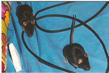
HIRNFORSCHUNG: Ein Zürcher Neurobiologe unterhält 400 Kilometer westlich von Moskau eine Forschungsstation. HORIZONTE hat ihn und seine russische Fachkollegin besucht.