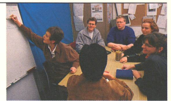
GEBÄRDEN PER MAUSKLIICK: Ein Team von Gehörlosen und Hörenden arbeitet an der ersten Computer-Datenbank der Deutschschweizer Gebärdensprache.