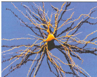
NEUROFORSCHUNG: Wenn Nervenzellen versagen, steht die Medizin oft hilflos da. Neurodegenerative Erkrankungen treten im Alter häufiger auf. In einer zunehmend älter werdenden Gesellschaft ist die Forschung gefordert.