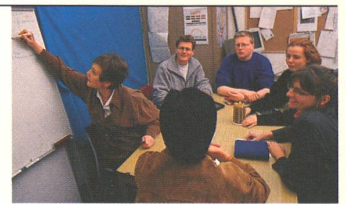
GEBÄRDEN PER MAUSKLIICK: Ein Team von Gehörlosen und Hörenden arbeitet an der ersten Computer-Datenbank der Deutschschweizer Gebärdensprache.