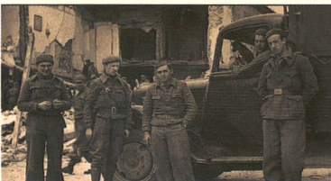
SCHWEIZER SPANIENKÄMPFER: Nach gefährlichem Einsatz im Bürgerkrieg folgte für viele die Bestrafung in der Heimat.