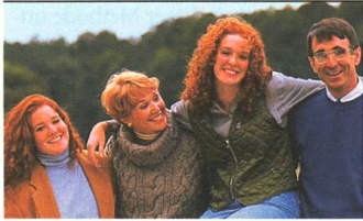
STIMMUNG IN DER FAMILIE: Ein Freiburger Psychologenteam schaut mit Minicomputern hinter die Fassade.