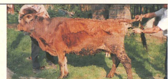
KRANK: Vier von fünf nordrumänischen Rindern leiden unter Knochenproblemen. Tierärzte führen die Gesundheitsmisere auf die desolante Umweltsituation zurück.