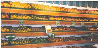
KONSUMIEREN: Um das Lebensniveau von Arm und Reich auszugleichen, müssen Nahrung, Wohnen und Gesundheit billiger werden, empfiehlt eine Ökonomin.