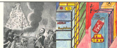
HELVETIK/BUNDESSTAAT: Wie erleben Menschen historische Umbrüche? Historiker blicken zurück, Kinder in die Zukunft.