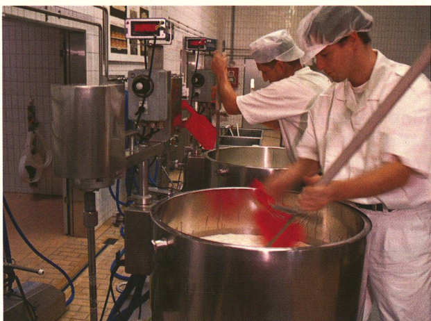
Modellkäserei in Bern-Liebelfeld: Die Herstellung von Forschungskäse verlangt peinliche Sauberkeit.

ob Rohmilch aus Silofutterproduktion trotz den darin enthaltenen, für Hartkäse zerstörerisch wirkenden Sporen des Bakteriums Clostridium tyrobutyricum verwendet werden kann.