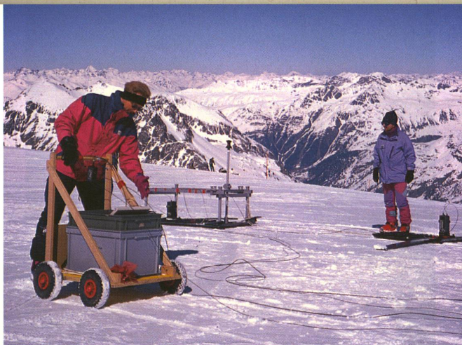
Versuche auf dem Eis: Forscher der ETH Zürich erproben ein mobiles Georadargerät für die Untersuchung bodennaher Schichten.