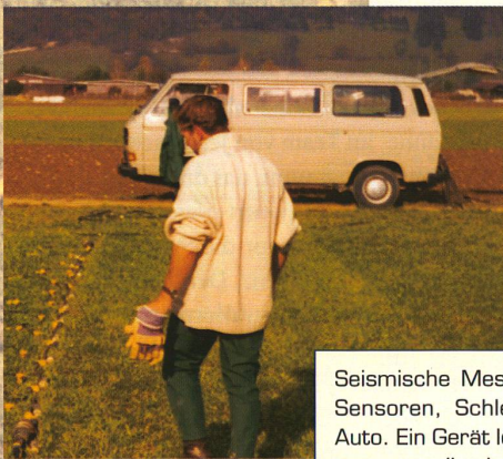
Seismische Messungen mit Sensoren, Schleppseil und Auto. Ein Gerät löst Vibrationen aus, die der Bordcomputer auswertet.

D as Interesse des von Professor Alan Green geleiteten ETH-Teams konzentriert sich auf die Struktur der unmittelbar unter der Erdoberfläche liegenden Schichten bis zu einer Tiefe von weniger als 300 Metern; diese sollen erforscht und mit sogenannten Tomographien dreidimensional abgebildet werden – und zwar nicht nur zuverlässig, sondern auch kostengünstig. Tomographien sind räumliche Bilder, wie sie auch die Ärzte verwenden, um beispielsweise im Innern des Gehirns einen kleinen Tumor genau und ohne operativen Eingriff zu lokalisieren.