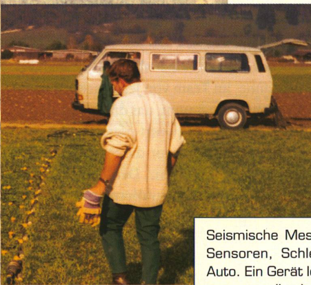
Seismische Messungen mit Sensoren, Schleppeil und Auto. Ein Gerät löst Vibrationen aus, die der Bordcomputer auswertet.

D as Interesse des von Professor Alan Green geleiteten ETH-Teams konzentriert sich auf die Struktur der unmittelbar unter der Erdoberfläche liegenden Schichten bis zu einer Tiefe von weniger als 300 Metern; diese sollen erforscht und mit sogenannten Tomographien dreidimensional abgebildet werden – und zwar nicht nur zuverlässig, sondern auch kostengünstig. Tomographien sind räumliche Bilder, wie sie auch die Ärzte verwenden, um beispielsweise im Innern des Gehirns einen kleinen Tumor genau und ohne operativen Eingriff zu lokalisieren.