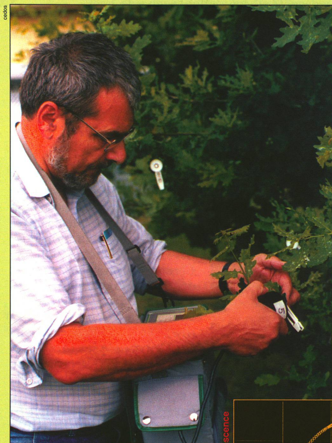
Eine Stunde vor der Messung wurden die Blätter dieser Eiche stellenweise durch weisse Klammern von der Lichtzufuhr abgeschirmt. Die Grafik zeigt, wie ein Pflanzenblatt auf zwei kurze, in sechs Sekunden Abstand erfolgte Lichtstösse (1 und 2) mit Fluoreszenz reagiert.

Platzes im Laubwerk recht unterschiedlichen Umwelteinflüssen ausgesetzt. Solche Messungen lassen sich nur im Gelände vornehmen. Deshalb haben die Schweizer Forscher die britische Firma Hansatech gebeten, ein tragbares Fluorimeter zu entwickeln. Das Gerät von der Grösse einer Pastmilchpackung enthält eine Lichtquelle, einen Empfänger und viel Elektronik.