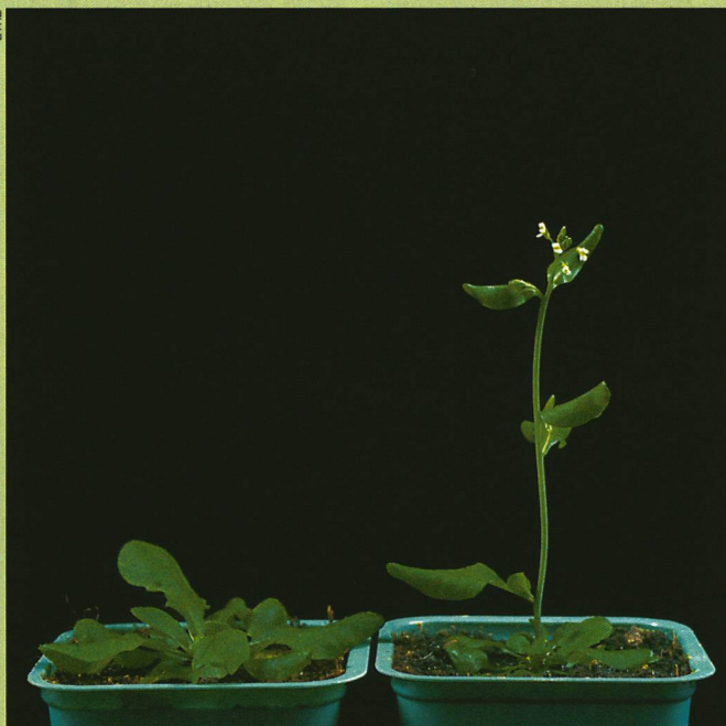
Beide vor drei Wochen gepflanzt: links eine wilde Arabidopsis , rechts eine transgene Form mit dem FPF-Gen.

Beleuchtet man damit nur die Blätter, kommt es zur Blühinduktion – nicht aber, wenn ausschliesslich der Apex mit zusätzlichem Licht bestrahlt wird. Weil es jeweils einen oder zwei Tage dauert, bis die Blüten zu wachsen beginnen, liegt der Schluss nahe, dass ein bisher noch unbekannter