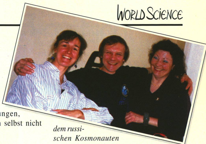
dem russischen Kosmonauten

«Natürlich arbeiten die Spezialisten im Weltraum weder deutlich langsamer noch unkoordinierter», erklärt Dieter Rüegg. «Allerdings verändert sich die Art, wie sie ihre Muskeln aktivieren, und ihre maximale Muskelkraft ist reduziert. Reflexe, die durch elektrische Reizung eines Nerven ausgelöst werden, sind zum Teil kleiner als normal. Bei einem Kosmonauten waren Reaktionszeiten (die kürzeste Zeit, während der er auf ein Licht reagieren kann) verlängert.