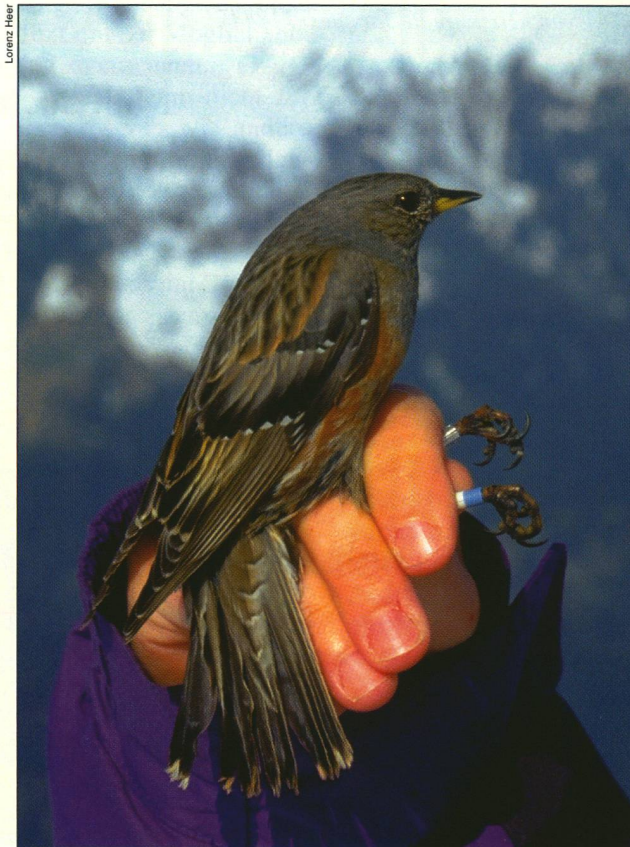
Diese Alpenbraunelle trägt zur Identifizierung auf Distanz farbige Ringe an den Beinen.

Minuten und spreche meine Beobachtungen auf Tonband.» Nach der Rückkehr ins Basislager am Nachmittag tippt Heer seine Erkenntnisse in einen tragbaren Computer, was eine weitere gute Stunde in Anspruch nimmt. So verläuft die Feldforschung an sechs Tagen pro Woche während drei bis vier Monaten.