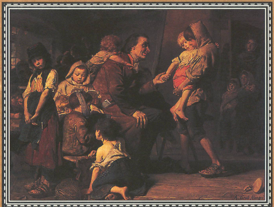
Pestalozzi als Waisenvater in Stans 1799 : Gemälde von Konrad Grob (1828-1904).

Um das Jahr 1810 hatte das Werk seine höchste Blüte erreicht. Auch im Ausland erlangten Pestalozzis Anstalt und Methoden einen guten Ruf, so in Preussen, England, Spanien und beim Russen Zar Alexander. Viele hochgestellte Leute schickten ihre Kinder nach Yverdon zur Erziehung. Leider führten Intrigen und Zwietracht unter den Mitarbeitern dazu, dass das Unterfangen 1825 aufgegeben werden musste. Enttäuscht zog sich Pestalozzi in seinen Neuhof im aargauischen Birrfeld