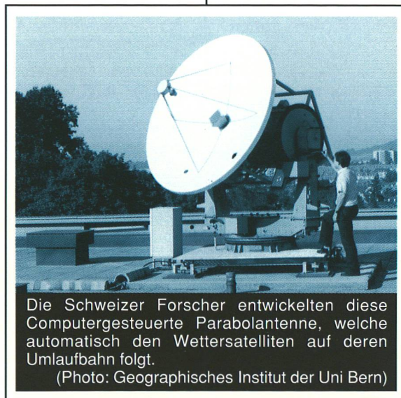
Die Schweizer Forscher entwickelten diese Computergesteuerte Parabolantenne, welche automatisch den Wettersatelliten auf deren Umlaufbahn folgt.

von den Universitäten Freiburg und Karlsruhe und Frankreich von den Universitäten Mülhausen und Strassburg. Das ist kein Zufall: alle diese Institutionen liegen im gleichen Industriegebiet und tragen das gleiche Risiko. Auch das Nationale Forschungsprogramm Nr. 14: "Lufthaushalt und Luftverschmutzung in der Schweiz" hat den Nebel in sein Repertoire aufgenommen.