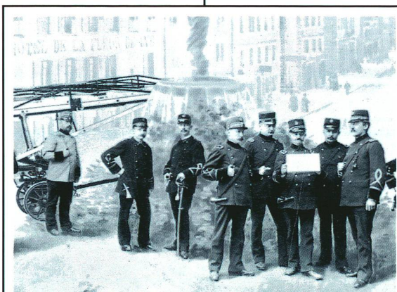
Das Feuerwehribattalion von La Chaux-de-Fonds anno 1896. Nach dem Brand von 1794 hat die Feuerwehr sorgfältig alle Baupläne aufgehoben, was die Dokumentensuche der Wissenschaftler erheblich erleichtert.

Die 40 Städte sind alphabetisch geordnet. Der erste Band beginnt mit "Aarau", der letzte endet mit "Zürich". Um schliesslich auch das ewige Sprachproblem möglichst gerecht zu lösen, beschloss man, jede Stadt in der ursprünglich von ihren Einwohnern gesprochenen Sprache zu beschreiben.