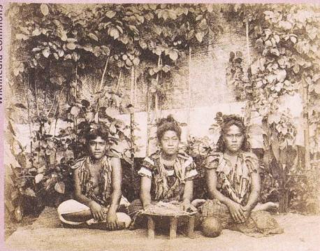
Trois femmes des îles Samoa préparant du kava. (1890 environ).

Christoph B. Graber, Karolina Kuprecht, Jessica C. Lai (éd.) : International Trade in Indigenous Cultural Heritage. Legal and Policy Issues . Edward Elgar, Cheltenham, Northampton 2012, 509 p.