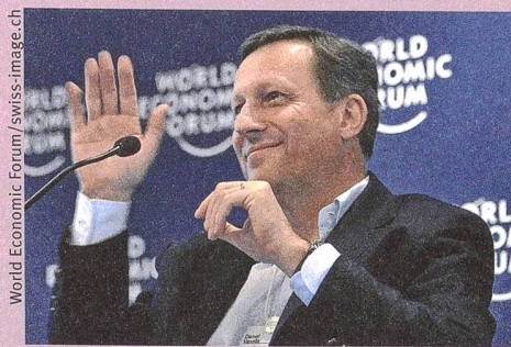
Le salaire et le parachute doré de l'ancien patron de Novartis Daniel Vasella ont suscité la polémique.