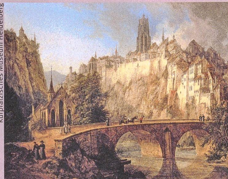
Dans son portrait de la ville de Fribourg (1826), Domenico Quaglio gomme sciemment le progrès technique, l'industrialisation et la pauvreté.

B. Roeck, M. Stercken, F. Walter, M. Jorio, T. Manetsch (éd.): Schweizer Städtebilder. Urbane Ikonographien (15.–20. Jahrhundert) – Portraits de villes suisses. Iconographie urbaine (XVe–XXe siècle) – Vedute delle città svizzere. L'iconografia urbana (XV–XX secolo) . Chronos, Zurich 2013, 640 p., 400 ill. en couleur.