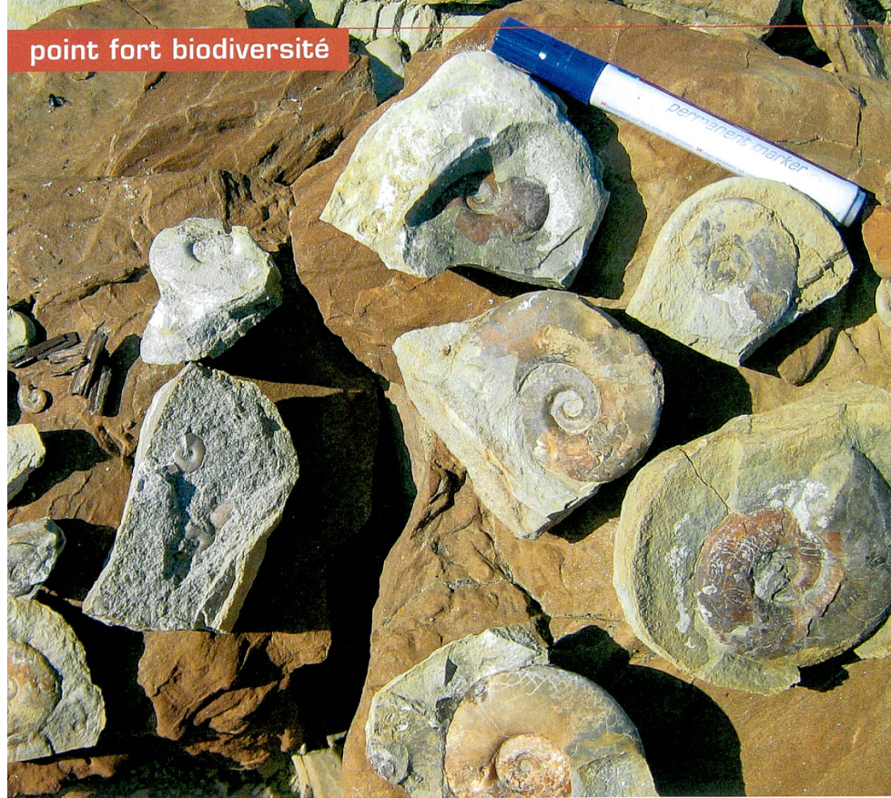
Ces ammonites témoignent de l'extinction massive d'espèces qui a eu lieu à la fin du Permien, il y a environ 250 millions d'années.

phère et le climat s'est réchauffé très rapidement: les déserts se sont étendus, la circulation océanique s'est affaiblie. En même temps, l'augmentation des quantités de CO 2 dissoutes dans la mer a acidifié l'eau, entraînant l'extinction de 95 pour cent des espèces marines. Les conséquences pour les organismes vivant sur la terre ferme ont été un peu moins dramatiques.