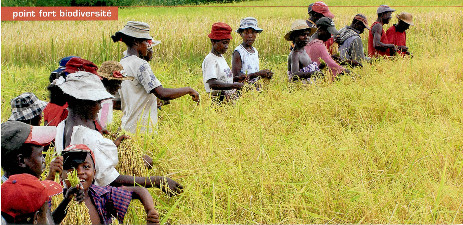
Dans le Parc national de Masoala, les paysans ont l'interdiction de cultiver les terres de leurs ancêtres.