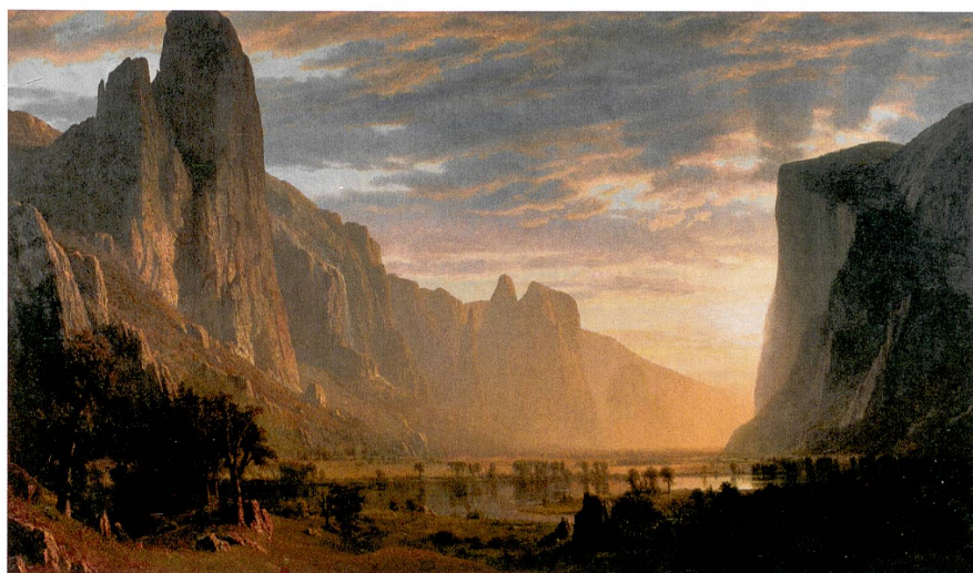
La vallée de Yosemite, un site exceptionnel à la beauté préservée (Albert Bierstadt: « Looking Down Yosemite Valley », 1865).