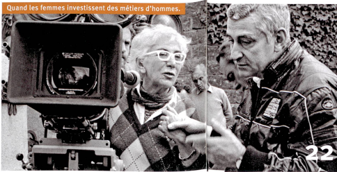
Quand les femmes investissent des métiers d'hommes.