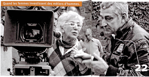
Quand les femmes investissent des métiers d'hommes.