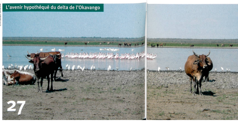
27 L'avenir hypothéqué du delta de l'Okavango