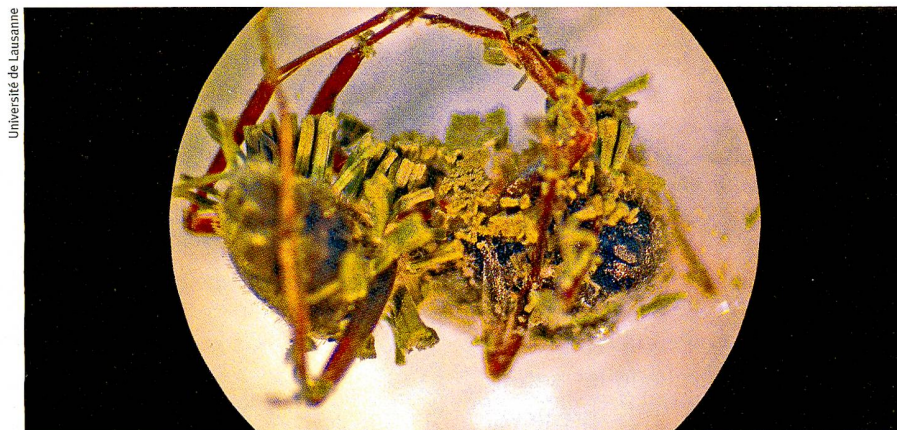
Une fourmi tuée par le champignon Metarhizium anisopliae (en vert).