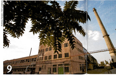
En Roumanie, d'anciennes industries hypothèquent la santé de la population.