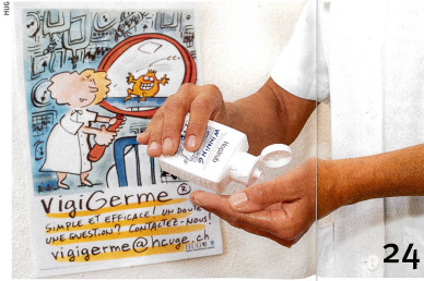
A l'hôpital, une bonne hygiène des mains sauve des vies.