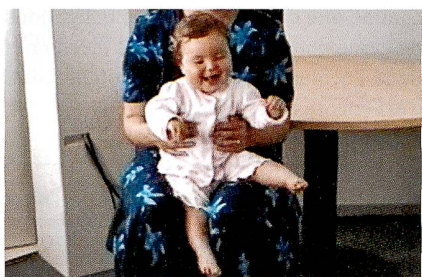
Fillette « dansant » au rythme de la musique.

Danser au rythme de la musique est un comportement répandu dans toutes les cultures et qui est habituellement vu comme le produit d'une acculturation progressive dès le plus jeune âge. Deux études pionnières menées à Genève et à