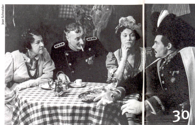
Le premier grand dictionnaire sur le théâtre en Suisse.