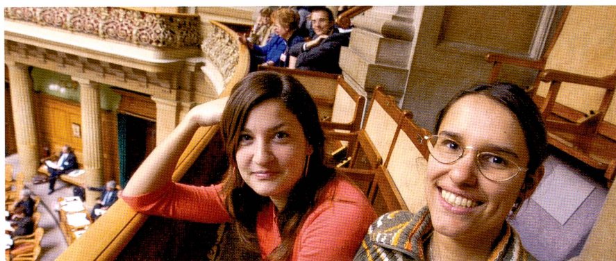
Des «secondos» intéressées par la politique, dans la tribune du public du Conseil national.