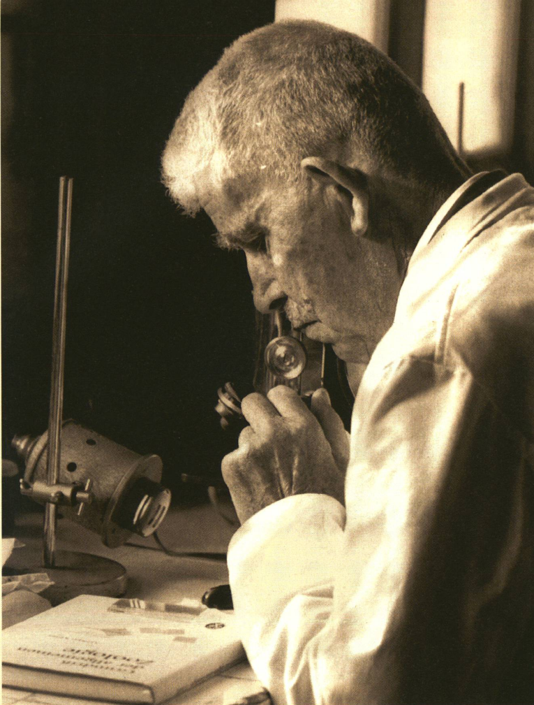
Fritz Baltzer en 1965, photographié par l'un de ses étudiants.

litaine. Quelle est la composition de la substance génétique des hybrides et quelle influence a-t-elle sur la respiration? Les deux scientifiques publient leurs résultats plus tard dans une revue spécialisée de renom, Nature . Ainsi on apprend qu'il existe un rapport étroit entre l'ADN et les comportements cytologiques et morphologiques des hybrides.