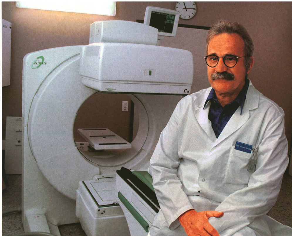
Le professeur Helmut Mäcke devant la caméra à rayons gamma qui permet de réaliser les scintigrammes d'un corps entier.

Au total, l'équipe scientifique bâloise a déjà synthétisé près de cent nouveaux radiopeptides, testés sur des lignes cellulaires et au cours d'expérimentations animales. Les chercheurs ont combiné quatre hormones avec différents agents radioactifs. Ils ont réussi à accoupler même plusieurs molé-