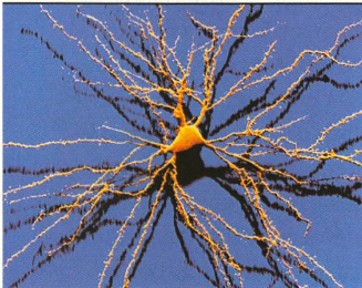
NEUROSCIENCES: Les cellules nerveuses ne se régénèrent pas, une fois lésées. Les maladies qui en découlent, telles qu'Alzheimer ou Parkinson, augmentent avec l'âge. Dans une société toujours plus vieillissante, la recherche sur le cerveau compte.