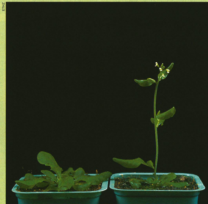
Plantées il y a trois semaines: à gauche une Arabidopsis sauvage; à droite la forme transgénique munie du gène FPF.

la floraison des Arabidopsis . La conséquence de cette floraison précoce, c'est que les plantes de laboratoire produisent un peu moins de feuilles que normalement, mais elles arborent tout autant de fleurs. L'explication de cette floraison accélérée tient évidemment au génie génétique: ces Arabidopsis ont été «équipées» d'un gène de floraison que les chercheurs ont d'abord prélevé chez la plante de moutarde.