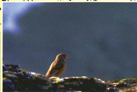
Sonagramme de E. Tretzel d'après un enregistrement sonore de A. Aichhorn (tiré de Glutz von Blotzheim & Bauer, Handbuch der Vögel Mitteleuropas 10, Aula-Verlag, Wiesbaden).

Dans un guide ornithologique célèbre, on dit que «le chant de l'Accenteur alpin est un gazouillis soutenu, au sol ou en cours de vol nuptial, rappelant l'alouette des champs: Trri-trui-tuituitui-trri...» Cette retranscription donne un pâle reflet du plus mélodieux des oiseaux de l'alpe. Aussi, les ornithologues emploient les sonagrammes , des graphiques destinés à représenter le chant des oiseaux. Mais, pour le profane, décrypter un sonagramme, c'est comme lire une partition de musique sans avoir appris le solfège! Pour se rendre compte des vocalises du «ténor des alpages», il vaut donc mieux aller le matin sur l'alpe, entre mai et juillet.