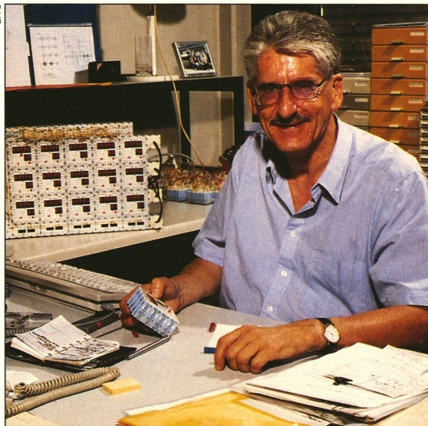
Le Prof. Daniel Mange et ses «biodules».

Les chercheurs du Laboratoire de systèmes logiques les ont appelés «biodules». Chaque bloc abrite un microprocesseur et possède un tableau d'affichage digital lumineux, comme ceux des réveils électroniques. Lorsque la démonstration démarre, seul le premier biodule a reçu en mémoire un petit programme à exécuter, à l'instar d'un ovule fécondé qui recèle dans son ADN l'ensemble du programme de l'organisme qu'il va créer en se divisant. Le premier biodule commence par copier son programme dans le second