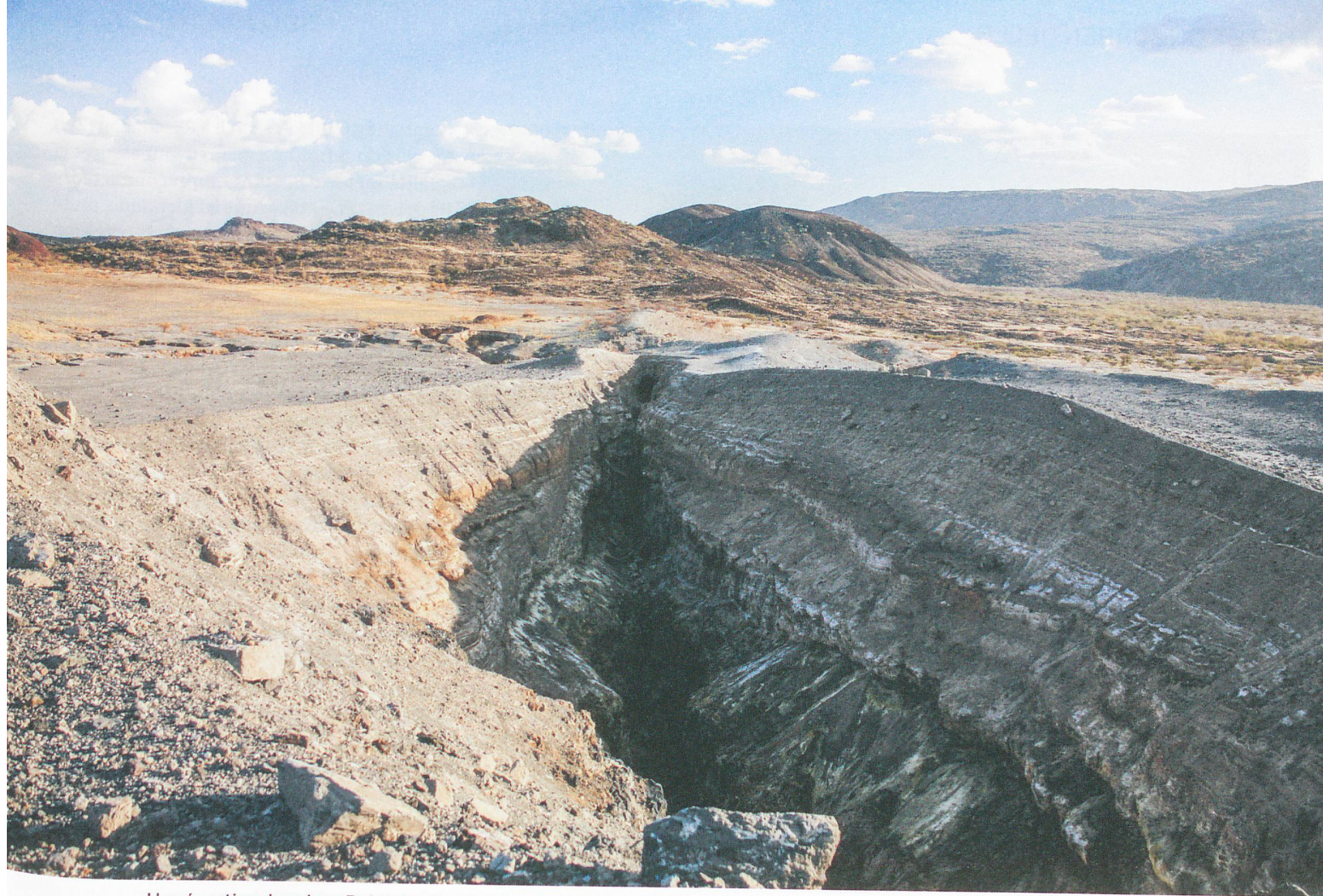
Une éruption du volcan Dabbahu dans le triangle d'Afar, en 2005, a généré cette grande faille, connue sous le nom de faille de Dabbahu.