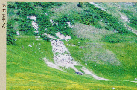
Une pente érodée dans la vallée d'Urseren, notamment à cause de l'élevage bovin.