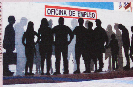
Un graffiti dans la ville espagnole de Saragosse illustre le chômage dans le pays.

M. Vacchiano et al.: The family as (one- or two-step) social capital: mechanisms of support during labor market transitions. Community, Work and Family (2019)