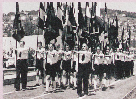
La «Colonie allemande en Suisse» marche à travers le Letzigrund en 1941.