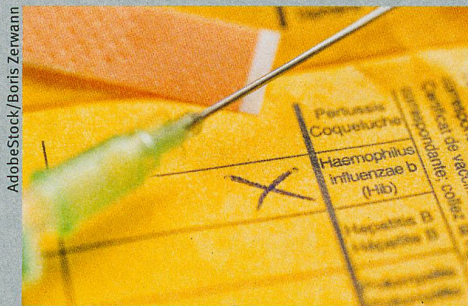
La vaccination est moins efficace chez les nouveau-nés.