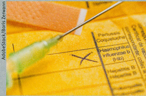
La vaccination est moins efficace chez les nouveau-nés.