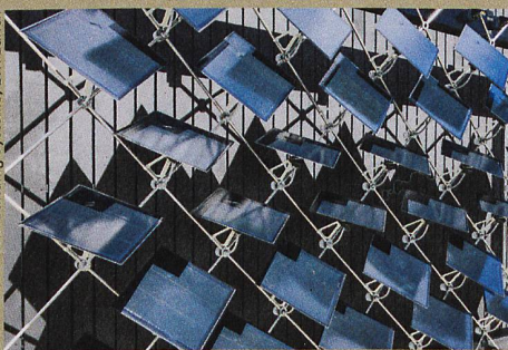
Les éléments photovoltaïques mobiles suivent le soleil comme des tournesols.

B. Svetozarevic et al.: Dynamic photovoltaic building envelopes for adaptive energy and comfort management. Nature Energy (2019)