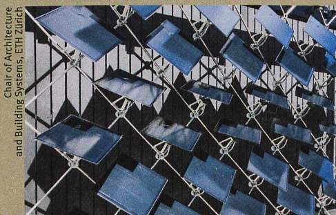
Les éléments photovoltaïques mobiles suivent le soleil comme des tournesols.

B. Svetozaevic et al.: Dynamic photovoltaic building envelopes for adaptive energy and comfort management. Nature Energy (2019)