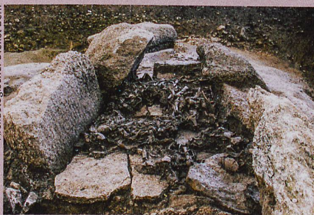
Des archéologues ont fait parler ces fragments d'os trouvés à Oberbipp (BE). Leur âge: 5000 ans.

Siebke et al.: Who lived on the Swiss Plateau around 3300 BCE? Analyses of commingled Human Skeletal Remains from the Dolmen of Oberbipp. International Journal of Osteoarchaeology (2019)