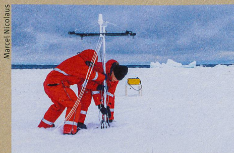
Des mesures faites dans la mer de Weddell en Antarctique ont produit les données du modèle.

N. Wever et al.: Version 1 of a sea ice module for the physics based, detailed, multi-layer SNOWPACK model. Geoscientific Model Development (2019)