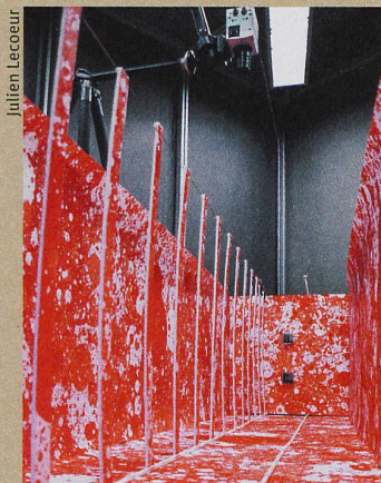
Des caméras suivent le vol d'insectes dans un corridor aux parois bariolées.