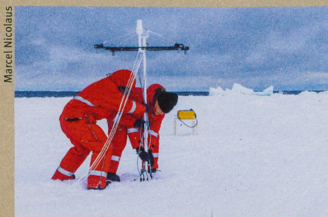
Des mesures faites dans la mer de Weddell en Antarctique ont produit les données du modèle.

N. Wever et al.: Version 1 of a sea ice module for the physics based, detailed, multi-layer SNOWPACK model. Geoscientific Model Development (2019)