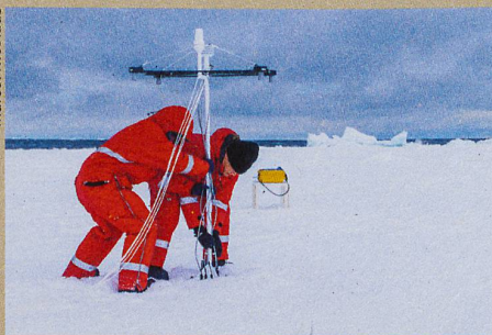
Des mesures faites dans la mer de Weddell en Antarctique ont produit les données du modèle.

N. Wever et al.: Version 1 of a sea ice module for the physics based, detailed, multi-layer SNOWPACK model. Geoscientific Model Development (2019)