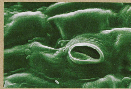
Grâce à ses pores, la plante respire et réagit aux changements d'humidité.