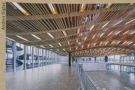
Exemple de construction numérique et robotisée: le toit du Arch-Tec-Lab à l'ETH Zurich.