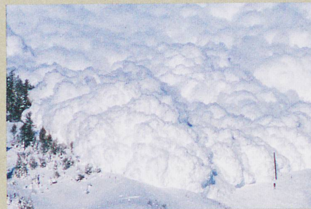
Un radar observe l'intérieur d'une avalanche artificielle déclenchée près d'Arbaz (VS).