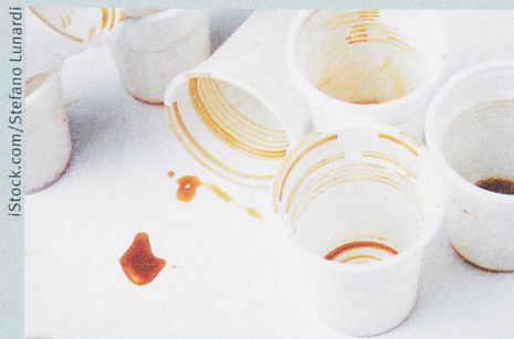
Consommer de la caféine pour se réveiller? Cela ne marche pas forcément.