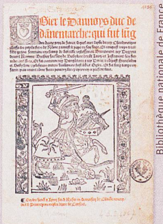
A l'origine du roman de chevalerie: une guerre commerciale.