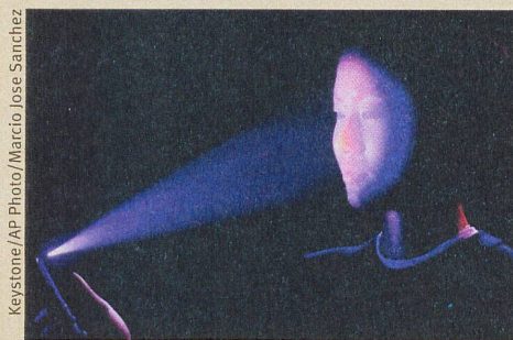
Pour reconnaître le visage d'un usager: un nuage de faisceaux laser.

D. Frick et al.: Exploiting structure of chance constrained programs via submodularity. Automatica . Arxiv (2018)