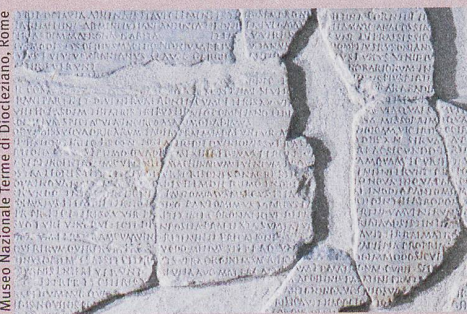
Les rites furent gravés dans la pierre pour survivre à la mémoire humaine.

B. Schnegg, Commentaria ludorum saecularium , De Gruyter (à paraître en 2019)