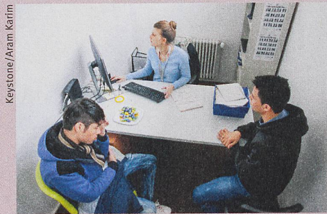
La destinée des demandeurs d'asile dépend de la culture au sein de l'administration.