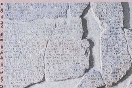
Les rites furent gravés dans la pierre pour survivre à la mémoire humaine.

B. Schnegg, Commentaria ludorum saecularium , De Gruyter (à paraître en 2019)