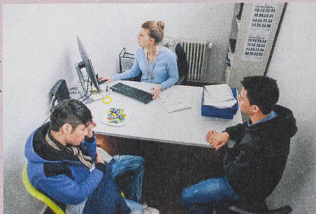
La destinée des demandeurs d'asile dépend de la culture au sein de l'administration.