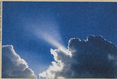
Une ombre passant sur un panneau solaire crée une différence de tension électrique nuisible.