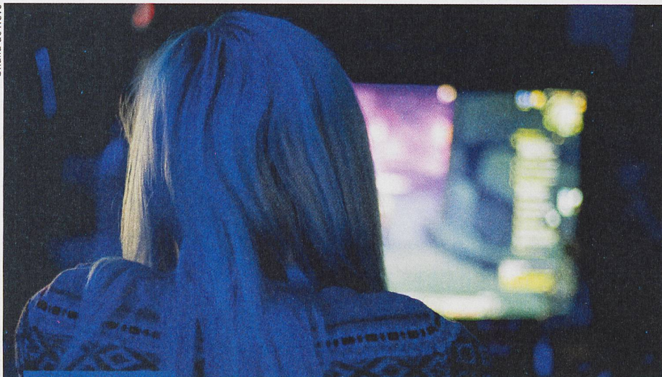
Point fort Jeux vidéo