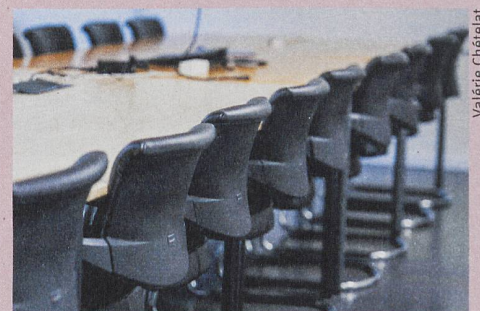
Pour éviter les incivilités lors des séances, des règles claires sont nécessaires.